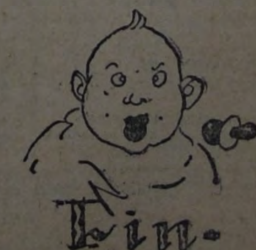
Ilust. por Novaro.

Ocasionalmente no pocas molestias; introducen el desorden en nuestras habitaciones; cuestan dinero en abundancia, y, sin embargo, nadie quisiera tener la casa desprovista de ellos. No sería un hogar si no resonaran por allí sus manecitas haciendo diabluras. No parecerían tanto silenciosos los aposentos a no oírlos a ellos patear allí de cuando en cuando, y no habían de aflojarse los lazos que os unen unos a otros si no viniere a apretarlos la charla de aquellas lengüecillas?