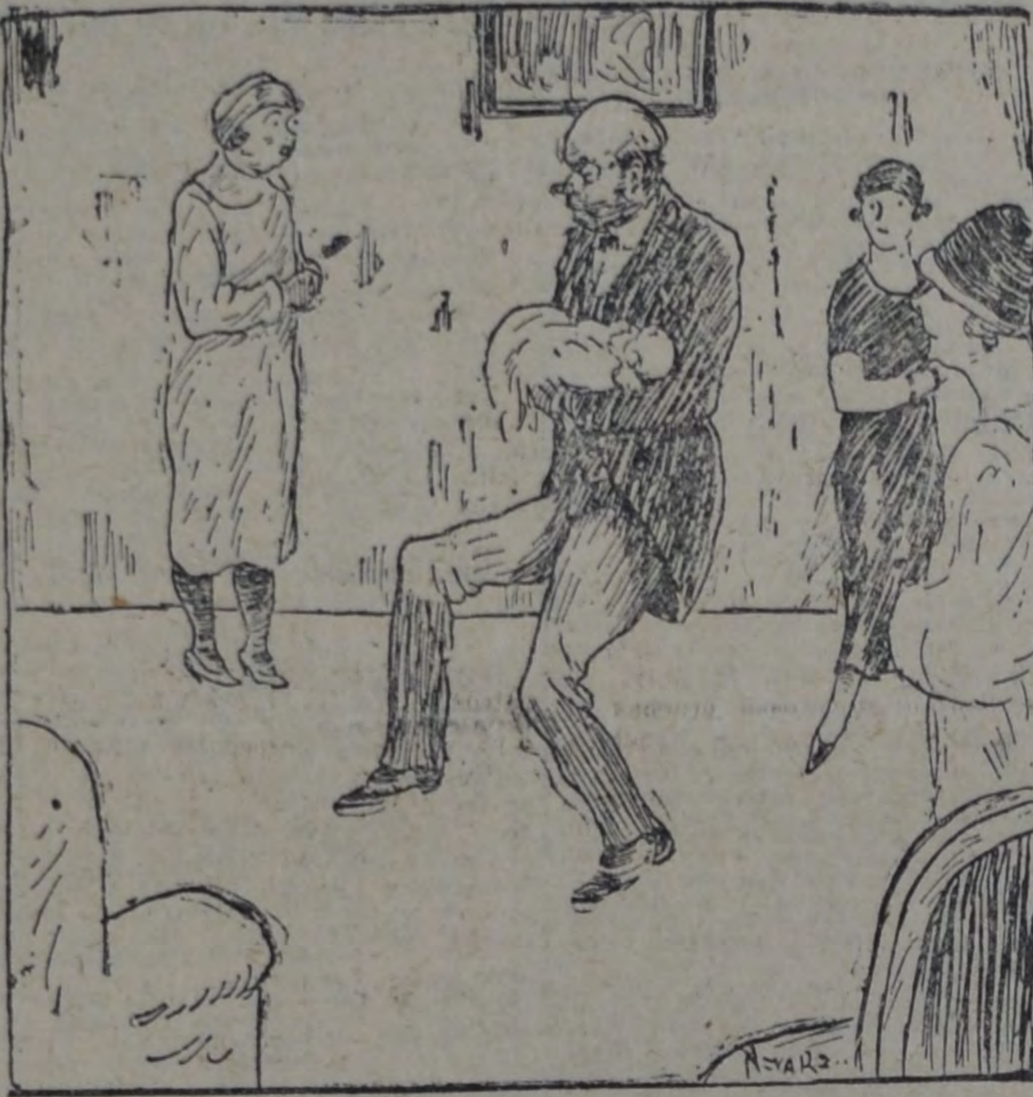
"No la haga saltar así, señor, que la criatura va a ponerse mal".

Sea como fuere, y búsquese la excusa que se quiera para justificarlo, ello es que la cosa resulta una broma pesada. Suenan un timbre y alguien da orden de que traigan el chiquillo. Como a una señal convenida, cuantas mujeres están